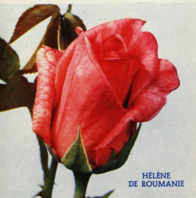
HÉLÈNE DE ROUMANIE